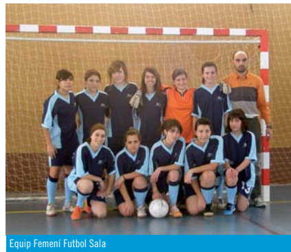
Equip Femení Futbol Sala

Aquesta temporada el CEDI, en la disciplina del futbol sala, juga en una nova competició. Les categories d'infantil i cadet, alumnes de 1r i 2n i 3r i 4t d'ESO, respectivament, competeixen en les lligues organitzades per la Federació Catalana de futbol sala. Això ha estat possible, gràcies, al nivell que han assolit els nostres jugadors després de varis anys de practicar aquest esport. Per l'equip d'entrenadors del CEDI, aquest fet ens esperona per tal de seguir treballant en la mateixa línia, i alhora ens serveix d'estímul per millorar en aquells aspectes que s'han de corregir, polir o bé, incorporar-ne de nous, en els equips de base del club, que no són altres, que el nens i nenes de pre-benjamí, benjamí i aleví.