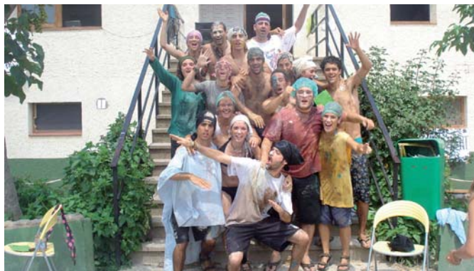
Colònies Estiu 2009. Can Bajona, Clariana de Cardener

Després d'innombrables anys fent colònies, infants i monitors n'hem passat de tots colors. Hem vist, escoltat i viscut les històries més divertides i estranyes que mai ens haguéssim pogut imaginar. Des del món del còmic, amb l'Astèrix i l'Obèlix , a l'època dels romans i els grecs, passant per les trepidants aventures d'herois catalans i fins i tot atrevint-nos a aventurar el futur. Tots nosaltres hem gaudit any rere any de la temàtica de cada colònia. I és que escollir quina serà la història protagonista dels deu dies més emocionants de l'estiu no es pot deixar mai a mans de l'atzar.