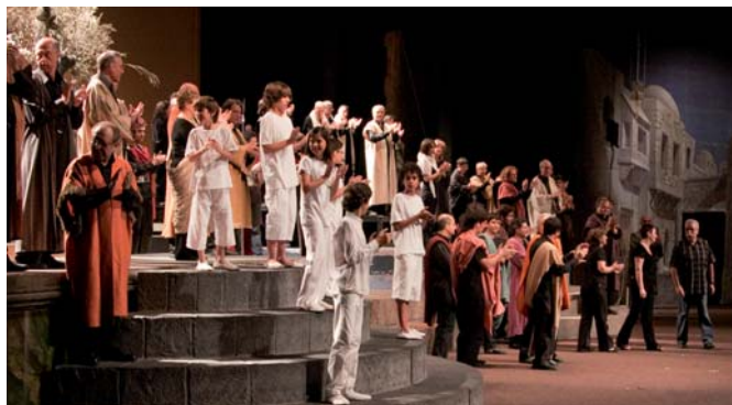
Companyia de Teatre Daina-Isard. Mirada enrere (2009)

El teatre és un exercici de responsabilitat compartida en què el jo i el tots s'han de conjuntar a partir de la lliure acceptació d'un compromís i de la implicació.